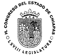
DIP. PAOLA VILLAMONTE PEREZ PRESIDENTA DE LA COMISION DE GRUPOS VULNERABLES DEL ESTADO